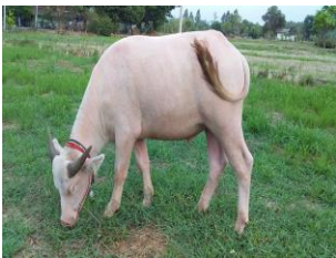
เยี่ยมชมเจ้าบัวลอย ควายเผือก → แสนรู้