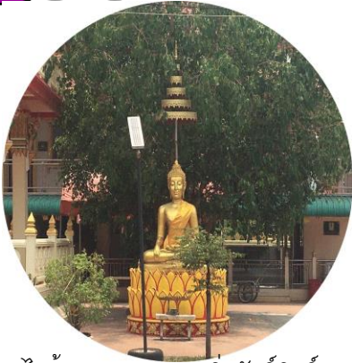
“กราบไหว้บูชาพระพุทธรูปสิงค์ศักดิ์สิทธิ์ประจำวัด”