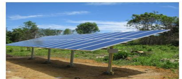
การใช้พลังงานแสงอาทิตย์ทดแทนพลังงานไฟฟ้า

๕. การนำสิ่งอื่นมาใช้ทดแทนการนำสิ่งอื่นมาใช้ทดแทนทรัพยากรธรรมชาติและสิ่งแวดล้อมบางชนิดอาจทำได้ เช่น การนำก๊าซธรรมชาติ มาใช้ทดแทนน้ำมันเชื้อเพลิงในรถยนต์ การใช้พลังงานแสงอาทิตย์ทดแทนพลังงานไฟฟ้า ซึ่งทำให้ประหยัดค่าน้ำมันเชื้อเพลิงในการผลิตกระแสไฟฟ้า เป็นต้น