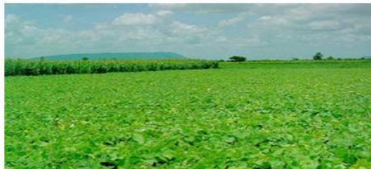
การปลูกพืชคลุมดินเป็นการอนุรักษ์ธรรมชาติด้วยการบูรณะ

๒. การบูรณะฟื้นฟู คือ การทำให้ทรัพยากรธรรมชาติและสิ่งแวดล้อมกลับคืนมาใช้ประโยชน์ได้เหมือนเดิม เช่น ดินที่นำมาใช้เพื่อการเพาะปลูกพืชชนิดเดียวกันติดต่อกันเป็นเวลานานจะทำให้คุณภาพของดินเสื่อมลง การบูรณะฟื้นฟูจะทำได้โดยการใส่ปุ๋ยปลูกพืชคลุมดิน หรือพักหน้าดินไว้สักช่วงระยะหนึ่ง เป็นต้น